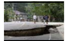
Zahl der Opfer auf Philippinen steigt weiter